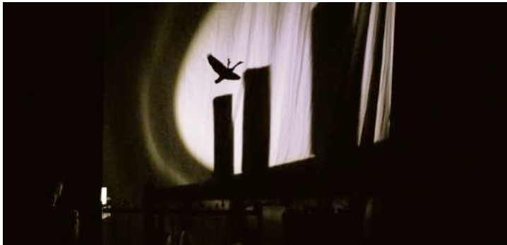
TABLEAU 1 : LA VILLE

La ville est en noir et blanc, en Playmobil, en Kapla et en petites voitures. Une lampe de poche se promène au rythme d'une bande son donnant à entendre les clameurs d'un jardin d'enfant et les moteurs et les klaxons des voitures. Et tel un long