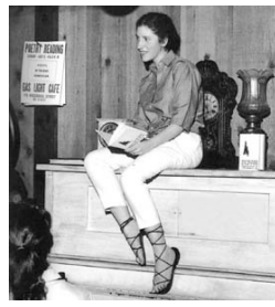
Diane Di Prima,